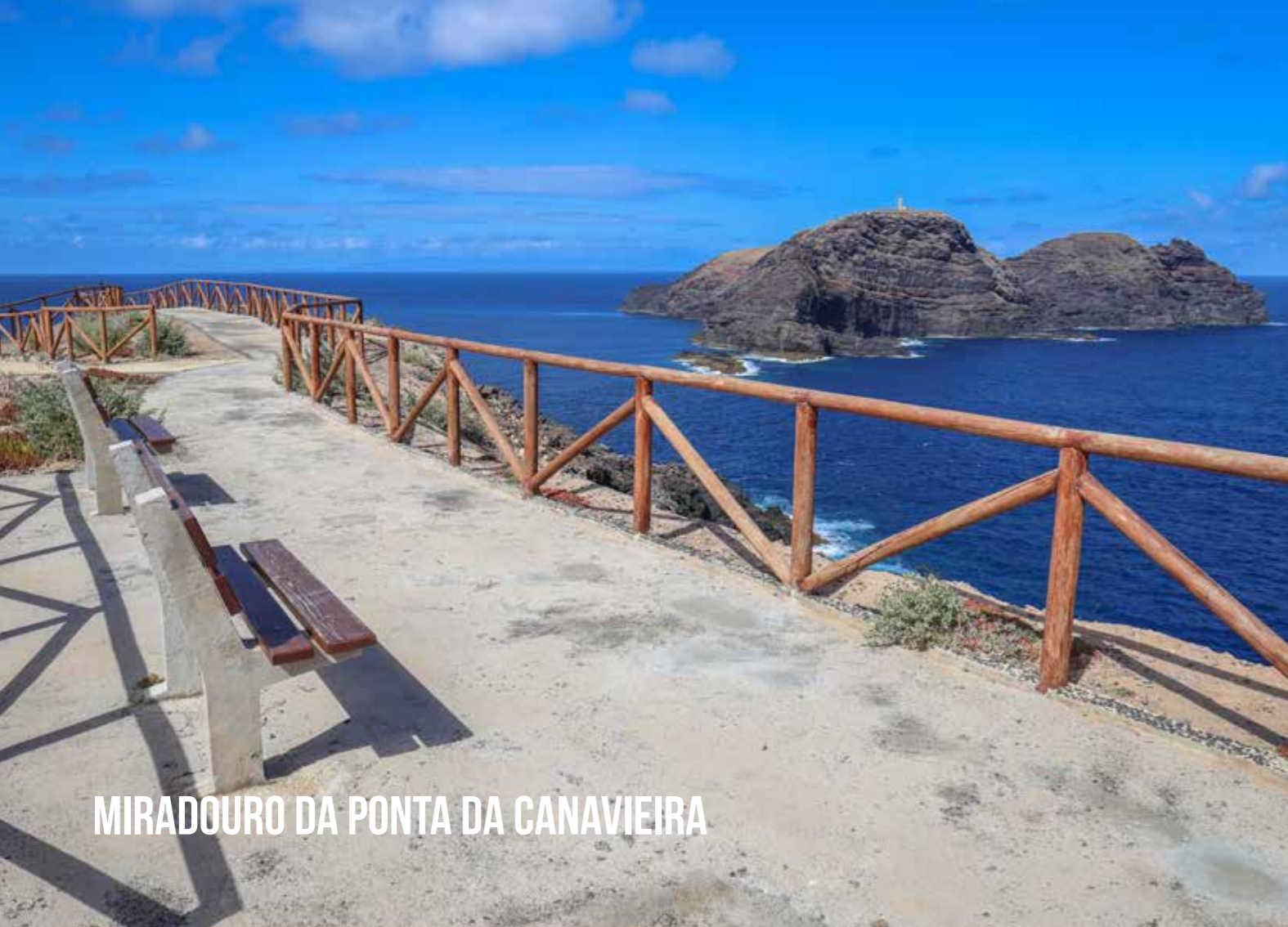
MIRADOURO DA PONTA DA CANAVIEIRA