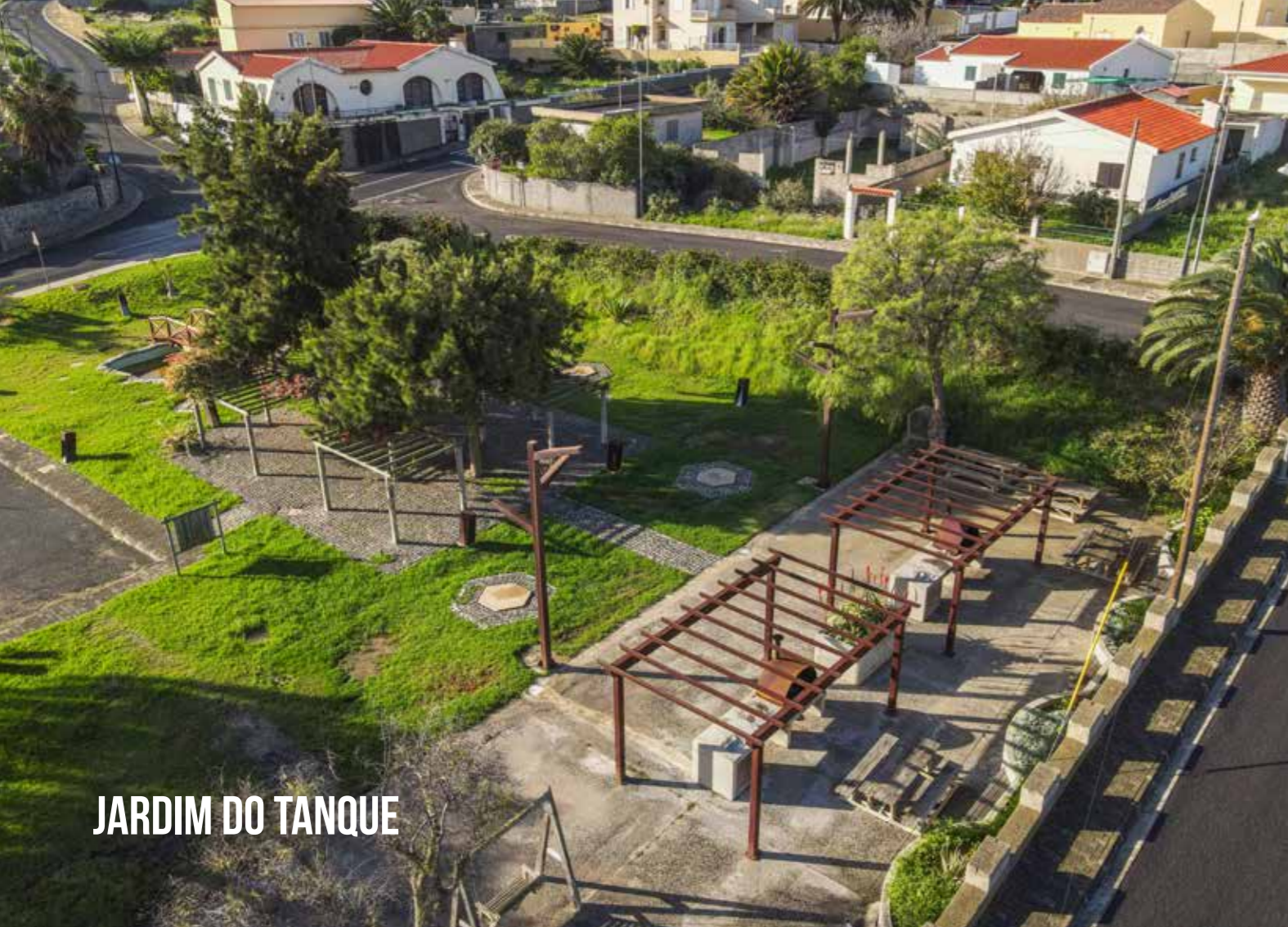
JARDIM DO TANQUE