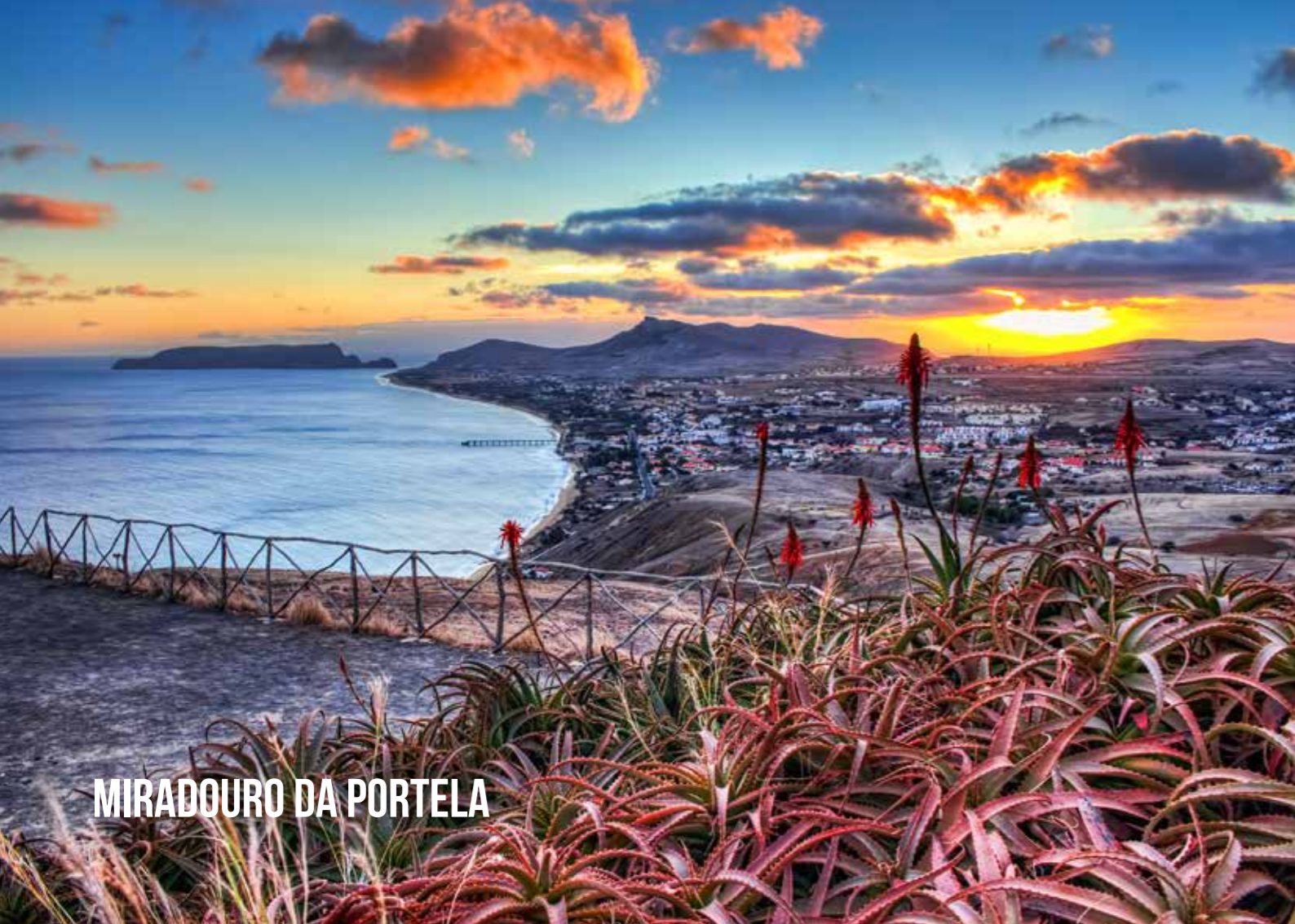
MIRADOURO DA PORTELA