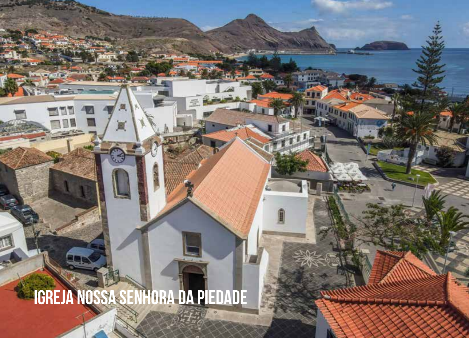
IGREJA NOSSA SENHORA DA PIEDADE