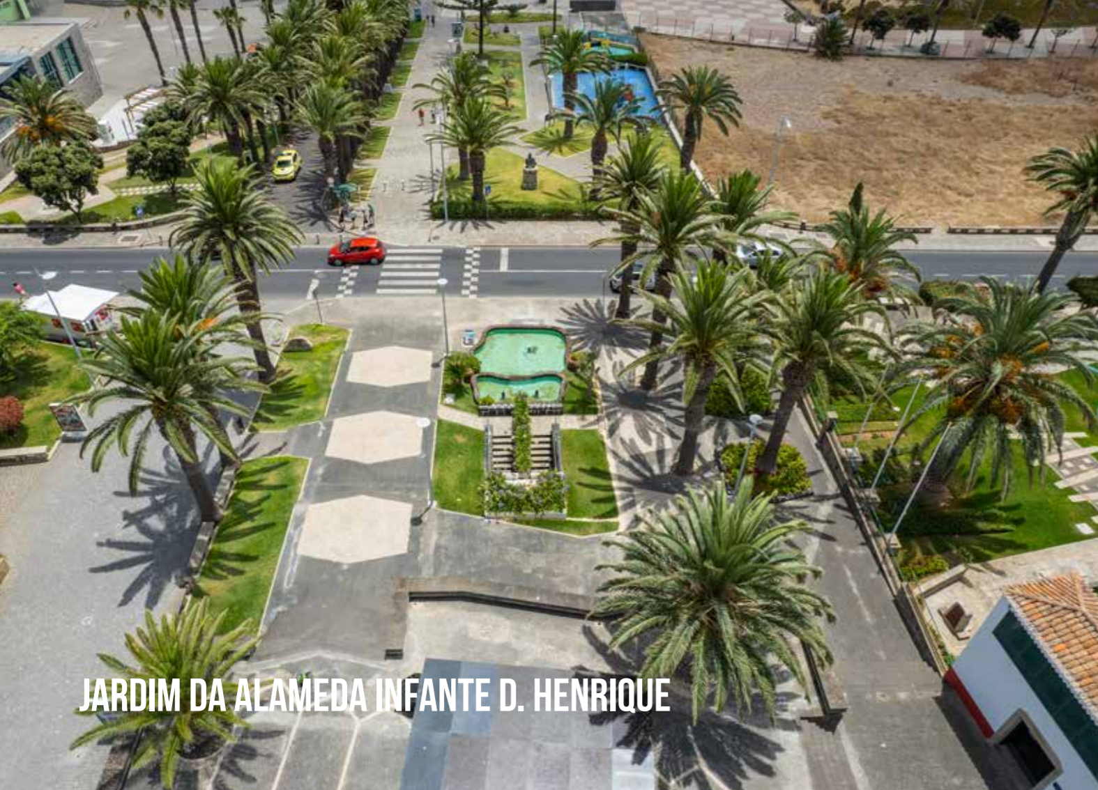
JARDIM DA ALAMEDA INFANTE D. HENRIQUE