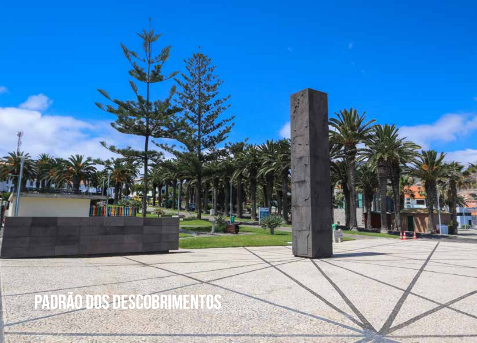
PADRÃO DOS DESCOBRIMENTOS